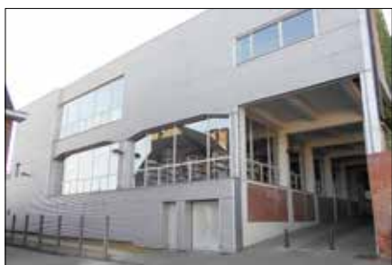
▲ Zicht op de bibliotheek en doorgang Brouwerijstraat vanuit de polderparking.