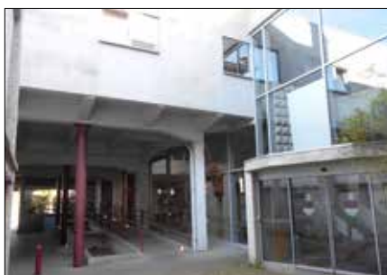
▲ De toegang tot de bibliotheek en het secretariaatsblok dat volledig zal worden afgebroken