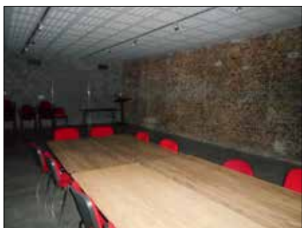
▲ Het toekomstige 'bezemkot'