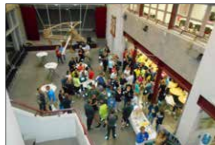
▲ De 'open' ontmoetingsruimte: té open?