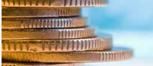
Alweer een (overbodige) studie: 30 000 euro p. 2