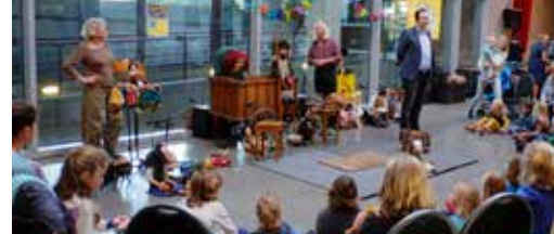
N-VA Kruike in de kijker p. 3